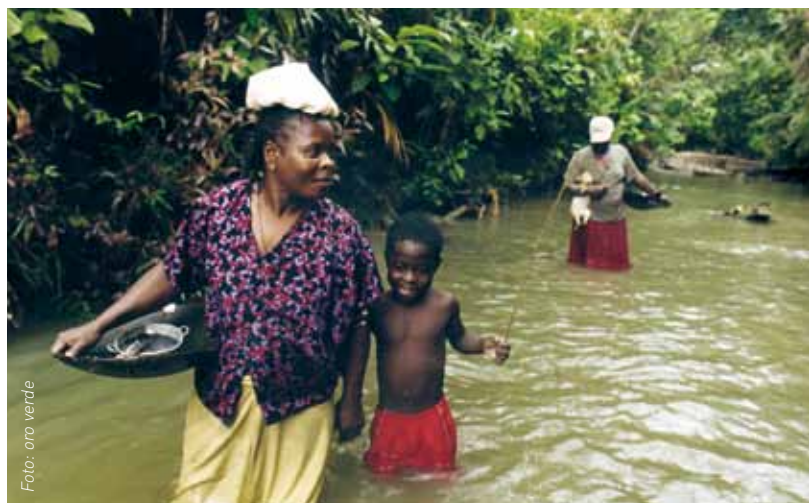
Grünes Gold: Im brasilianischen Chocó-Regenwald wird das erste zertifizierte Fairtrade-Gold der Welt geschürft, bei dem soziale und Umweltstandards garantiert werden.