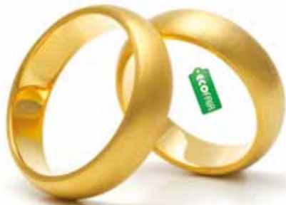
Ecofaire Trauringe aus Gelbgold 750 von Jan Spille.