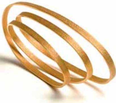
Armskulptur „pure“ von Ute Decker aus Fairtrade Gelbgold 750.

„ICH VERSUCHE, MIT MEINEM SCHMUCK ÄSTHETIK UND ETHIK ZU VERBINDEN, DENN ICH FINDE, DASS EIN SCHMUCKSTÜCK NICHT NUR VON AUSSEN SCHÖN SEIN SOLLTE, SONDERN AUCH VON INNEN.“